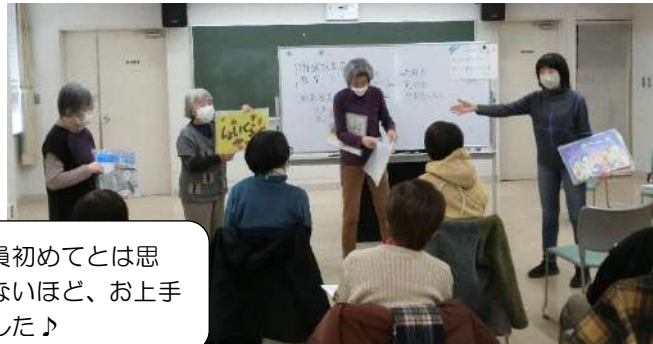
「原っぱ」の活動と紙芝居の紹介