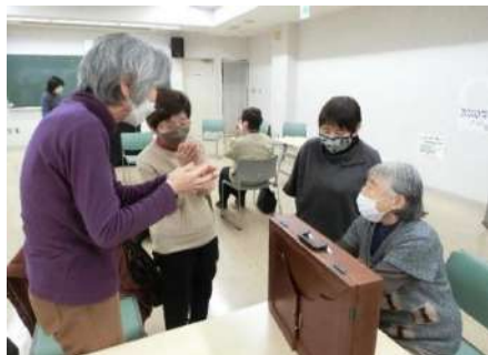
グループごとにレッスン

紙芝居サークル「原っぱ」の皆さんから、読み方のコツや紙芝居を引くタイミングなどのレッスンを受け、グループごとに発表しました。