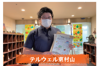
テルウェル東村山