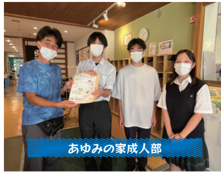
あゆみの家成人部