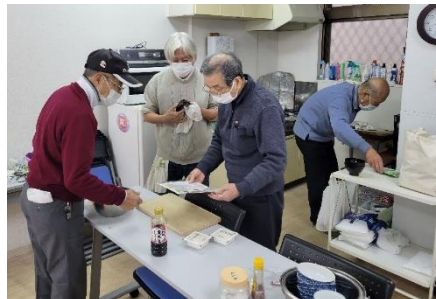
▲男の料理(お料理男子クラブ)