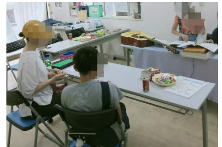
▲小中学生のフリースペース(ムジカマジカ)