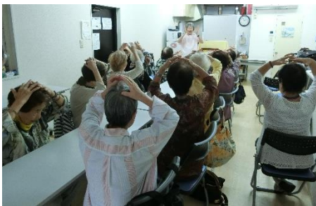
▲みんなで体操(栄サロン)