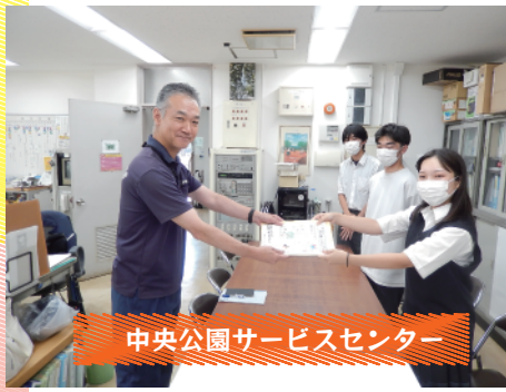
中央公園サービスセンター