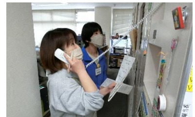
防災行政無線電話通話訓練の様子