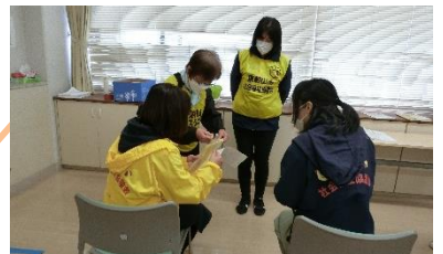
マッチングの様子