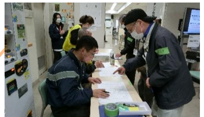
参加者と名簿を照合しています。