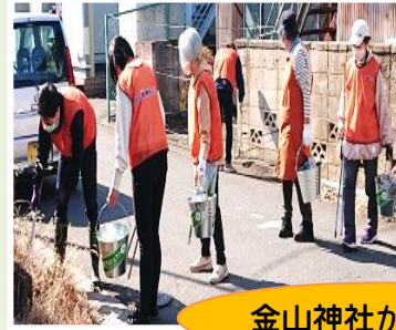
金山神社から出発