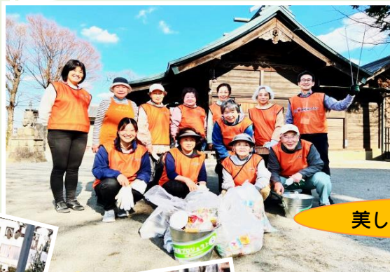
美しい町廻田町めざして