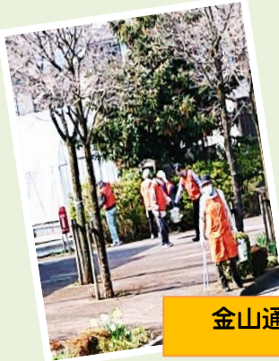
金山通りを右手、左手に分かれて活動しました