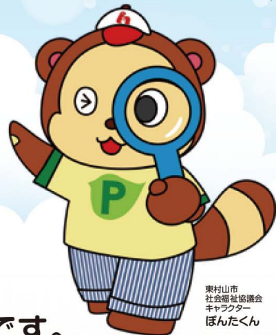
東村山市 社会福祉協議会 キャラクター ぼんたくん