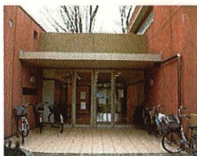
グリーントウン美住一番街第1集会所