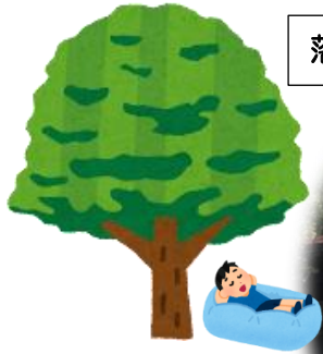
落ち着いた雰囲気の外観

昔ながらの古民家ですが、 無料 Wi-Fi あります！ 自転車も置けます (駐車場はありません！)