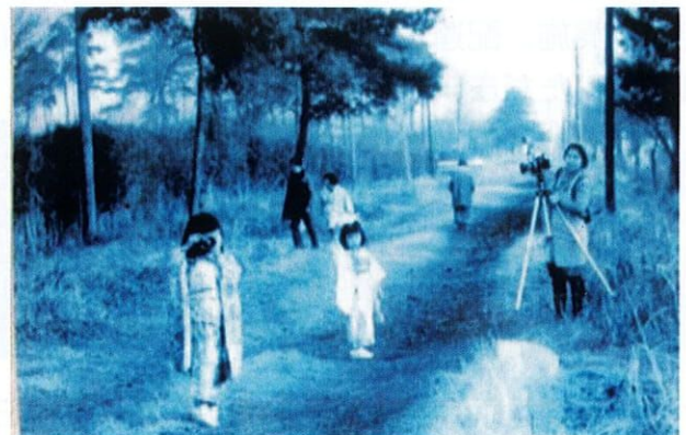
昭和 50 年ごろの「水道道路」