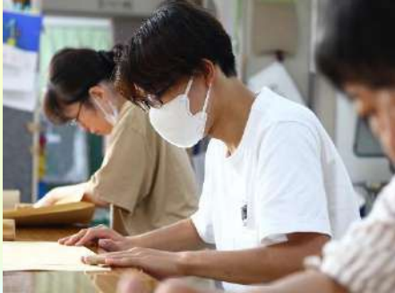
利用者さんと一緒に作業 (さつき荘)