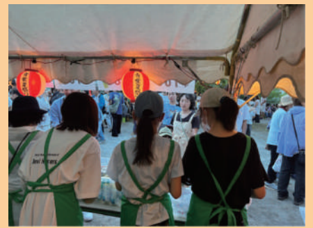
夏祭り実行委員会