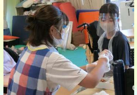
障害のあるお子さんの食事介助 (ひまわり)