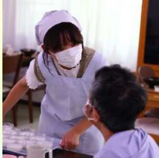
配膳中に利用者さんとお話 (さつき荘)