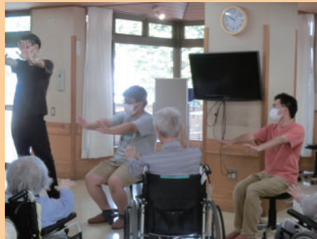
特別養護老人ホーム