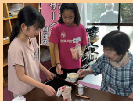
高齢者カフェ（サロン）