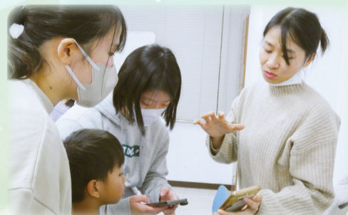
▲日本で暮らす工夫をお聞きしました