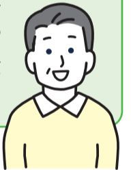
社協会員 / 50代男性

病気で足腰が弱った父の通院に悩んでいました。週一回のリハビリが必要でしたが、自宅周辺は段差や傾斜が多く、高齢の母が車椅子を押すのも限界でした。そんな時、社協の『移送サービス』を知り、安全に通院を継続できるようになりました。社協は、困りごとに寄り添い、暮らしを支えてくれる心強い存在です。これからもこの活動が続いてほしいという願いを込めて、私は会員になって社協を応援しています。