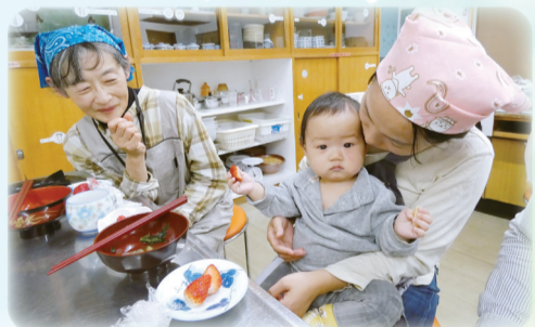
▲自分で握ったおにぎりを食べました

外国にルーツを持つ親子との交流会を行いました。東村山市内には約4500人の外国にルーツを持つ方が暮らしています。言葉の壁は、教育や子育て、医療や福祉サービスなど生活に欠かせない情報へのアクセスの難しさにもつながっています。こうした課題を解決していくためには、文化や言葉の違いを超えて交流できる場を広げ、互いに支え合える関係を地域の中に築いていくことが大切だと考えています。