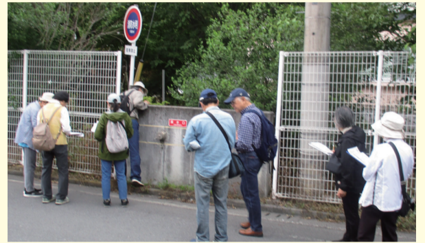
▲防災まち歩きの様子