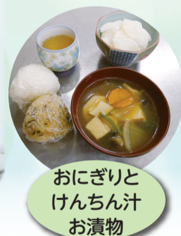
おにぎりとけんちん汁お漬物

今年で3年目を迎える東村山市第6次地域福祉活動計画。右記4つのアクションチームが様々な活動を進めています。子ども・若者の力をまちづくりに!つながりを実感できる東村山を目指して、一緒に活動しませんか。