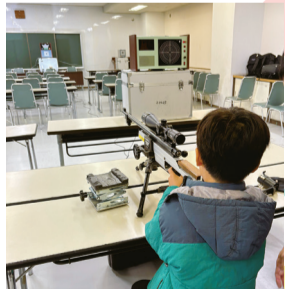
▲ビームライフル体験