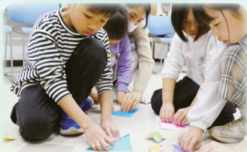
▲日本の遊びを一緒に楽しみました