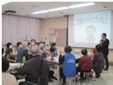
2023介護予防大作戦 萩山町地域開催の様子

主催: 2023介護予防大作戦in東村山 実行委員会 後援: 東村山市 問合せ: まちづくり支援係 ☎042-394-6333