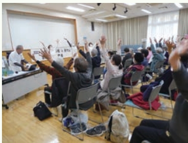
2023介護予防大作戦 恩多町地域開催の様子

地域の皆さんが元気に生きがいのある生活を続けられるように、各町の団体と連携して取り組んでいます。