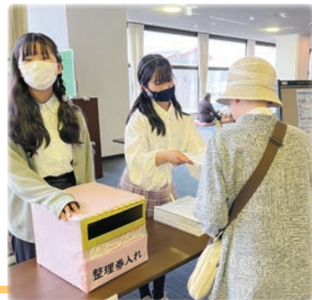
イベントの手伝いに学生さんも参加

福祉施設で使う雑布づくりやメッセージカードの作成など、自宅でできる活動もあります