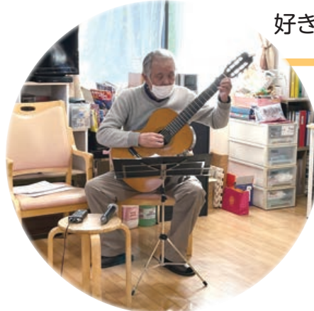
好きなことや特技を生かした活動