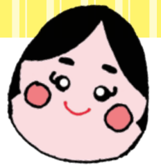
おためしふくし塾 イメージキャラクター「おたふくちゃん」