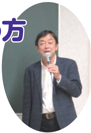
◀ 前回の講座の様子

昨年大好評だった終活講座を今年度も開催します。これからの人生を考えるきっかけとなる講座です。ぜひご参加ください!