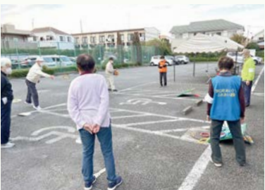
2022介護予防大作戦 野口町地域開催の様子(輪投げ)

地域のすべての人々が元気に健康で生活するために、日頃から健康に関心を持ち、介護予防と健康づくりに自ら進んで取り組むことが大切です。このことを一人でも多くの市民の皆さんに知っていただくことを目的に、地域の団体が連携して取り組んでいます。