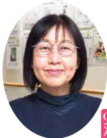
東村山市登録手話通訳者の会会長 Oさん