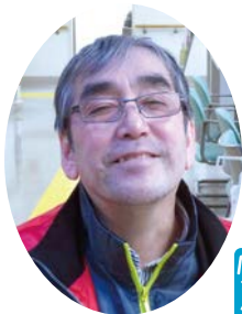
東村山市聴覚障害者協会会長 Mさん