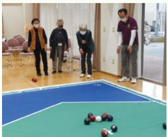
2022介護予防大作戦 美住町地域開催の様子(ポッチャ)

主催: 2022介護予防大作戦in東村山 実行委員会 後援: 東村山市 問合せ: まちづくり支援係 ☎042-394-6333