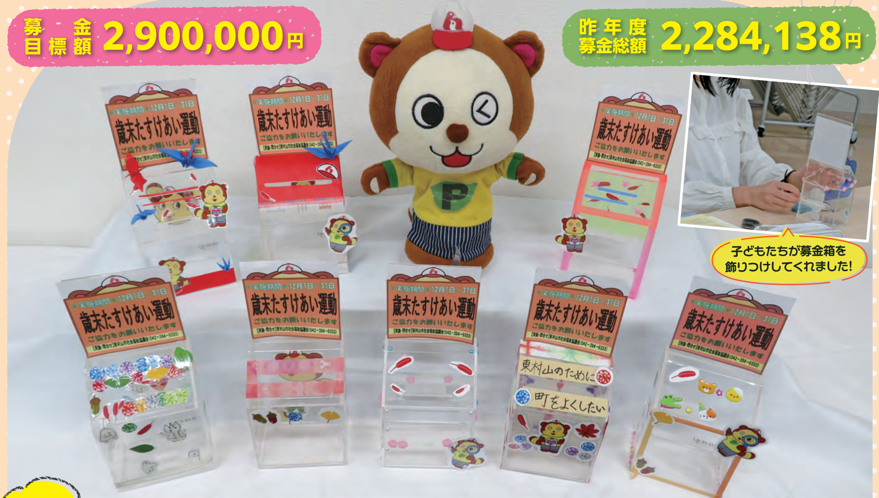
子どもたちが募金箱を飾りつけてくれました!