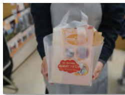
▲昨年のつどいセットです

場所:東村山市役所 グリーンバス停前 日時:12月7日(水)~9日(金) 午前10時~午後3時 主催:障害者週間・福祉のつどい実行委員会 問合せ:まちづくり支援係 ☎042-394-6333