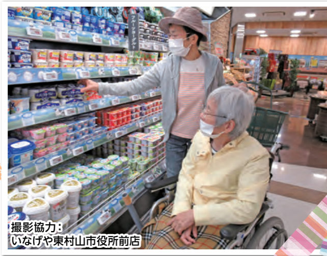
撮影協力: いなげや東村山市役所前店