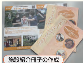
施設紹介冊子の作成