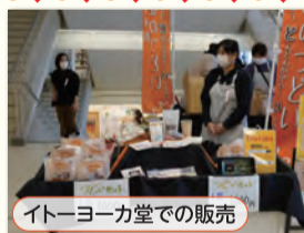
イトーヨーカ堂での販売