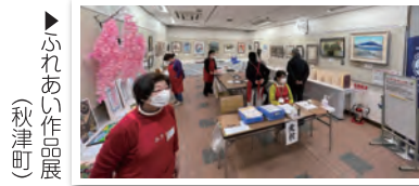
ふれあい作品展 (秋津町)

町内の交流やサロン活動等福祉協力委員会の推進。コロナの状況を見ながら、行事や定期的な広報誌の発行、電話訪問など地域のつながりづくりを進めました。