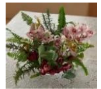
活動で活けたお花です☆