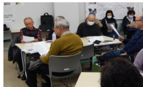
みんなで歌います♪