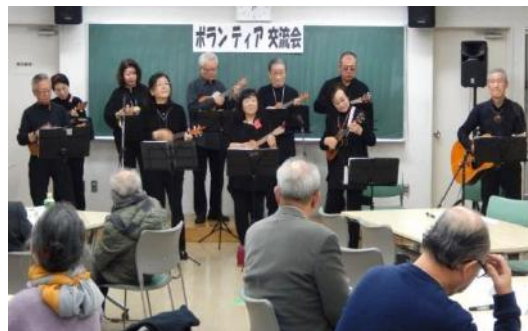
ウクレレふれあいサークルの皆さん